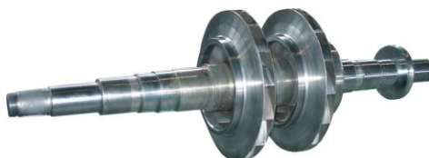
Рисунок 1 - Общий вид ротора ГПА

В настоящей работе были проведены численные исследования этого метода. В частности, был рассмотрен расчёт трехмассовой модели ротора турбокомпрессора ГПА на 16 МВт, общий вид которого дан на рис. 1.